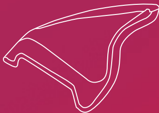
Vista desde el lateral - PhysioSelect TCR