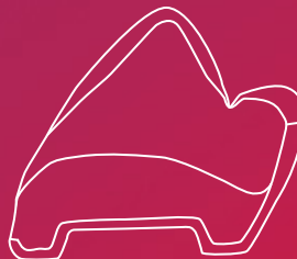
Vista desde el lateral - BonSelect TCR