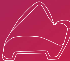
Ansicht von der Seite – BonSelect TCR